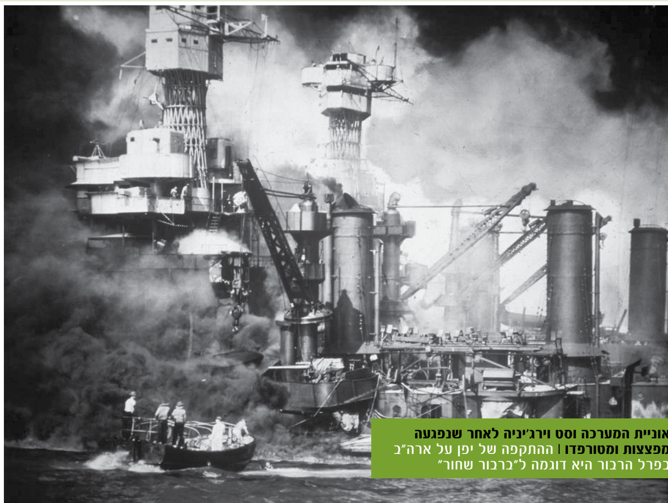
אוניית המערכה וסט וירג'יניה לאחר שנפגעה מפצצות ומטורפדו | ההתקפה של יפן על ארה"ב בפרל הרבור היא דוגמה ל"ברבור שחור"

הגורמים להפתעות בשדה הקרב וכיצד ניתן להתאושש מהן ולצמצם את השפעתן