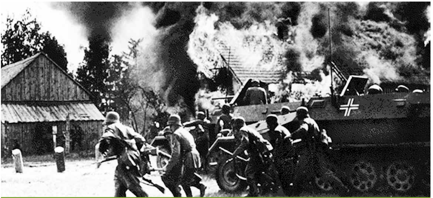
פלישת צבא גרמניה לפולין במלחמת העולם השנייה | "סיכוייה של גרמניה להכריע את פולין בהתקפת בזק אינם טובים", העריך קצין המודיעין האמריקני [ולימים פרשן צבאי מצליח] ג'ורג' פילדינג אליוט במאי 1939

גם טאלב מציין בספרו לחיוב את החשיבה האמפירית - שהיא בטוחה יותר מהערכות - אך גם הוא מקבל שהיא אינה אפשרית בכל תחום, ולעיתים אין מנוס מקבלת החלטות על סמך הערכות והנחות עבודה. המאמר הזה בוחן את תופעת "הברבור השחור" כפי שהיא באה לידי ביטוי בהקשרים שונים במלחמת העולם השנייה. בפרקים הבאים נציג שני מקרי בוחן מהמלחמה הזאת שניתן להגדירם ברבורים שחורים על פי הגדרותיו של טאלב.